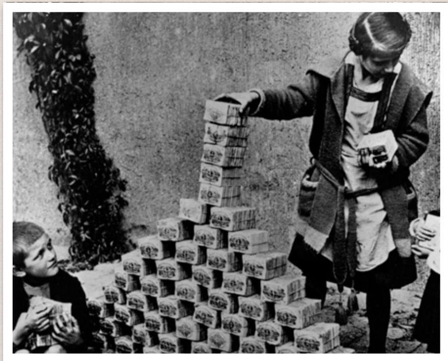
Barn leker med sedelbuntar. Hyperinflation i Tyskland 1923.