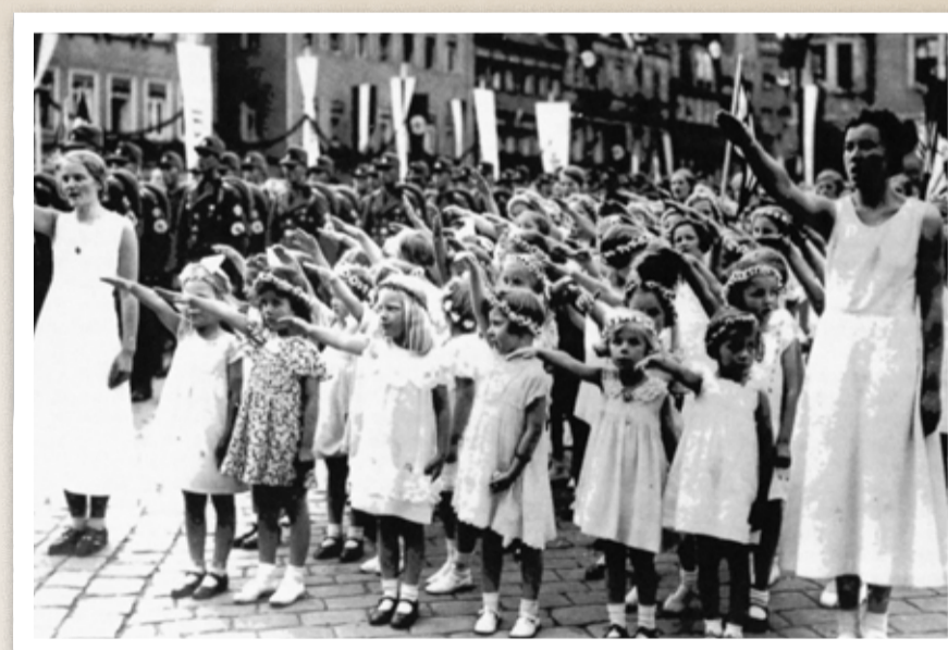
Unga tyska flickor får lära sig den nazistiska hälsningen i slutet av 1930-talet.

En viktig förutsättning för Hitlers väg till makten var ”presidentdiktaturen” som hade införts 1930. Avgörande blev sedan att antidemokratiska grupperingar som representerade de gamla eliterna – industrimännen, krigsmakten, godsägaradeln – blev ”stigbygelhållare” för att hjälpa Hitler ”upp i sadeln”.