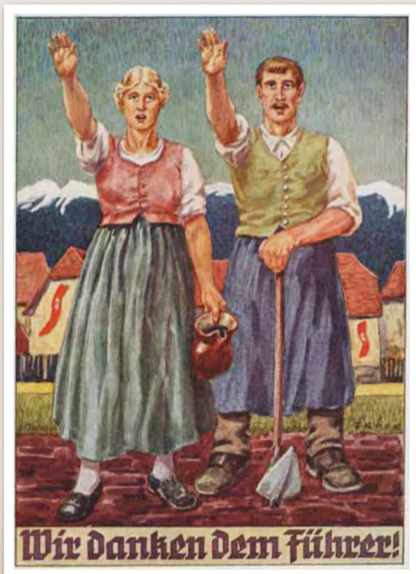
Vi tackar ledaren! Propaganda för annektering av Österrike 1938. Vykort.