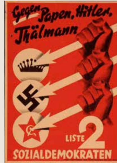
Valaffisch 1932, Socialdemokraterna. Okänd konstnär.

Valaffisch 1932. Vi arbetare har vaknat. Vi röstar på nationalsocialisterna.