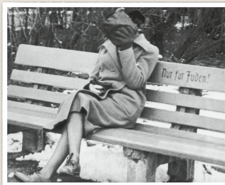
En judisk kvinna sitter på en parkbänk märkt ”endast för judar”. Österrike 1938.