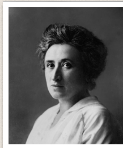
Rosa Luxemburg (socialdemokrat och senare kommunist) var en av ledarna för Spartacusförbundet.

Paragraf 48 in coffin, 1932, John Heartfield, collage