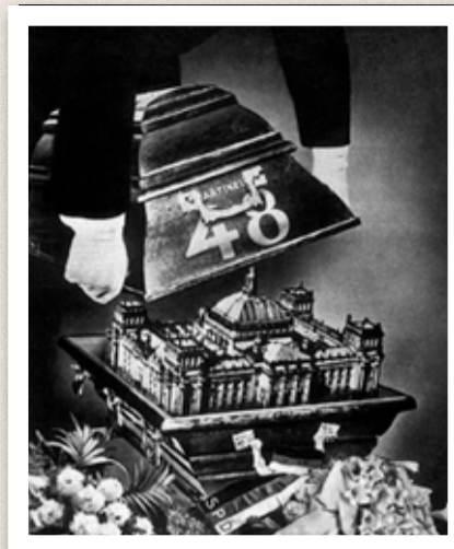
Bilden ska visa hur riksdagen och demokratin sätts ur funktion och begravs av paragraf 48.

Sebastian Haffner, En tysk mans historia: minnen 1914–1933 (2002)