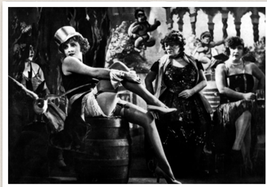
Marlene Dietrich. Foto från filmen Den blå ängeln , 1930.