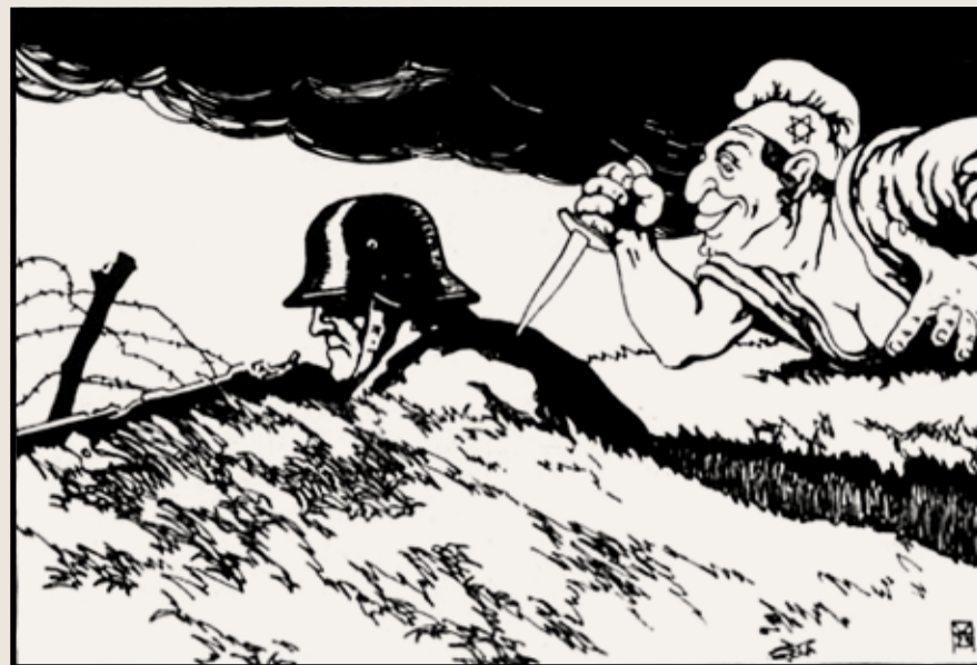
Dolkstöttslegenden. Österrikiskt vykort, 1919.

Tiggande krigsinvalid efter första världskriget, Berlin.