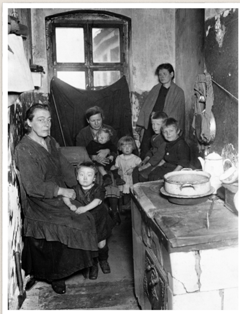
Kvinnor och barn i hem för fattiga under Weimarrepubliken 1922–23.