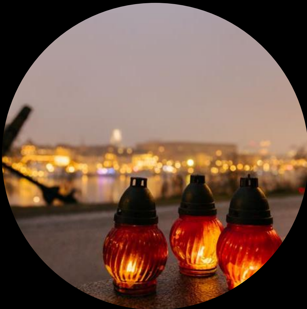
Förintelsens minnesdag 2024