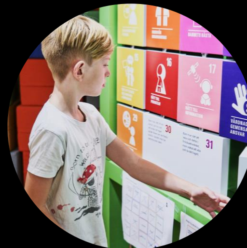
Workshop i utställningen Barn har också rättigheter .