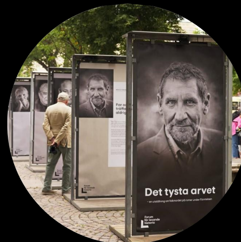
Minnesdagen för folkmordet på romer under Förintelsen 2 augusti och utställningen Det tysta arvet på Raoul Wallenbergs torg.